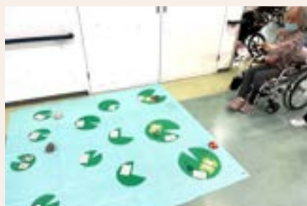
お手玉を投げてゲームをしました!