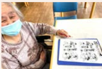
間違い探しは得意です☆