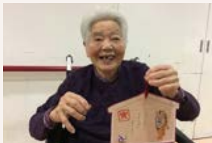
俳句：寅ちゃんのお目目とお口に守られて