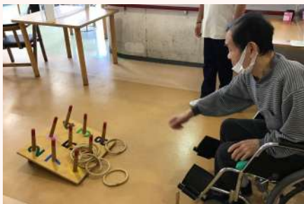
輪投げをしました♪