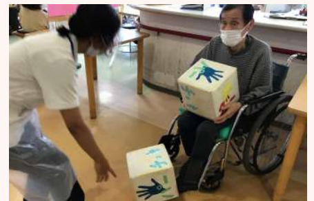
サイコロでジャンケンしました♪